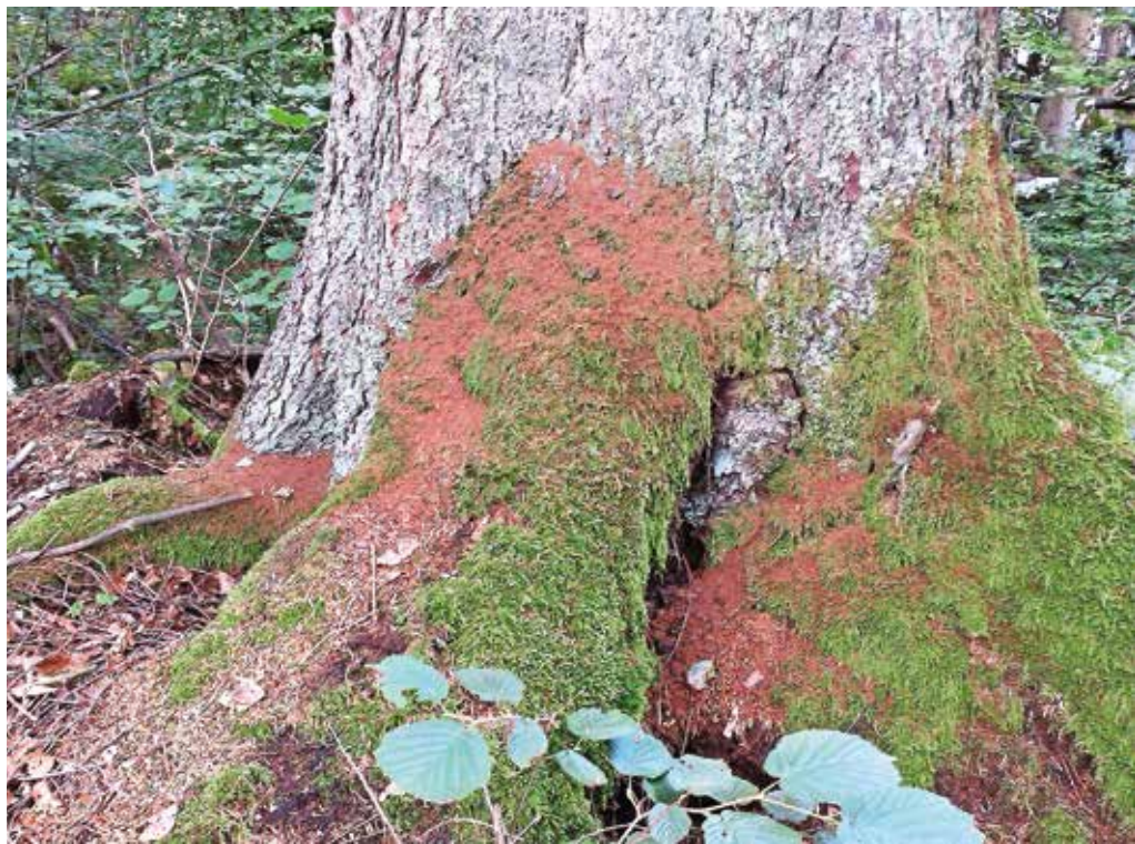
Lubadarke prepoznamo po rjavi črvini okoli koreničnika in za luskami skorje.

V drugi polovici julija se je začelo močno povečevati število s podlubniki napadenih dreves, zlasti smrek. Glavni vzrok za povečanje poškodb je letošnje izredno sušno in vroče poletje. Smreke so oslabele in postale manj odporne proti napadu podlubnikov, hkrati pa se je zaradi visokih temperatur razvoj podlubnikov pospešil. Vsa napadena drevesa še niso odkrita in popisana, obseg škode bo znan ob koncu zime. Povečan obseg poškodb zaradi podlub-