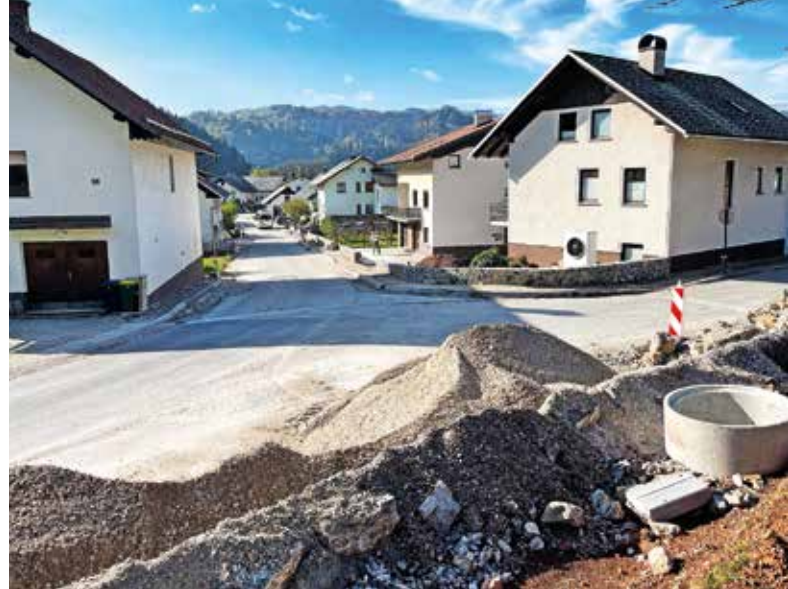
V Novi vasi poteka rekonstrukcija ceste in gradnja pločnikov na 550 metrov dolgem odseku.

Končali pa so že obnovo Dražgoške ulice, ki je bila v zelo slabem stanju, je pojasnil Kranjc. »Na novo smo uredili spodnji ustroj ceste in ga prevlekli z asfaltom. Sočasno so tamkajšnji prebivalci na lastne stroške poskrbeli za vgradnjo cevi za električne vode.« Občina je za naložbo odštela 60 tisoč evrov. Ta čas končujejo tudi asfaltiranje štirih odsekov cest v okolici Žirov, naložba je vredna 130 tisoč evrov. »Domačini iz Koprivnika, Jarče Doline in Žirovskega Vrha so pripravili spodnji ustroj ceste na dosedanjih makadamskih cestah, občina pa je financirala asfaltiranje,« je pojasnil Kranjc. Pred kratkim so začeli obnavljati še Ulico Maksima Sedeja, in sicer gre za obnovo dotrajanega vozišča, ob katerem bodo zgradili še novo javno razsvetljavo. Obstoječo cesto bodo razširili in tako kot v Novi vasi položili cevi za optično omrežje, obenem bodo zamenjali vodovodno in kanalizacijsko omrežje. »Dela bodo vredna 350 tisoč evrov, njihov zaključek pa je predviden prihodnje leto.« Kranjc je poudaril še gradnjo opornega zidu ob cesti v Novi vasi, kjer je struga Račeve spodjedla cesto; dela bodo vredna okrog 50 tisoč evrov. V Žirovnici pa so sanirali brežino ob cesti, ki je bila poškodovana v septembrskih poplavih, za kar so odšteli 15 tisoč evrov. »Sicer pa glede na