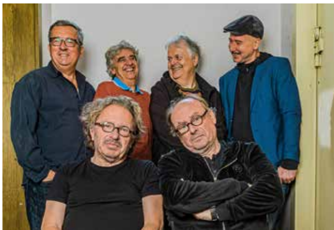
Ustvarjalci predstave Moj živòt je ROKentROL