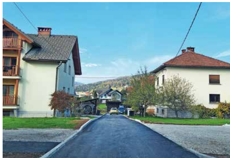
Obnova Dražgoške ulice je zaključena.