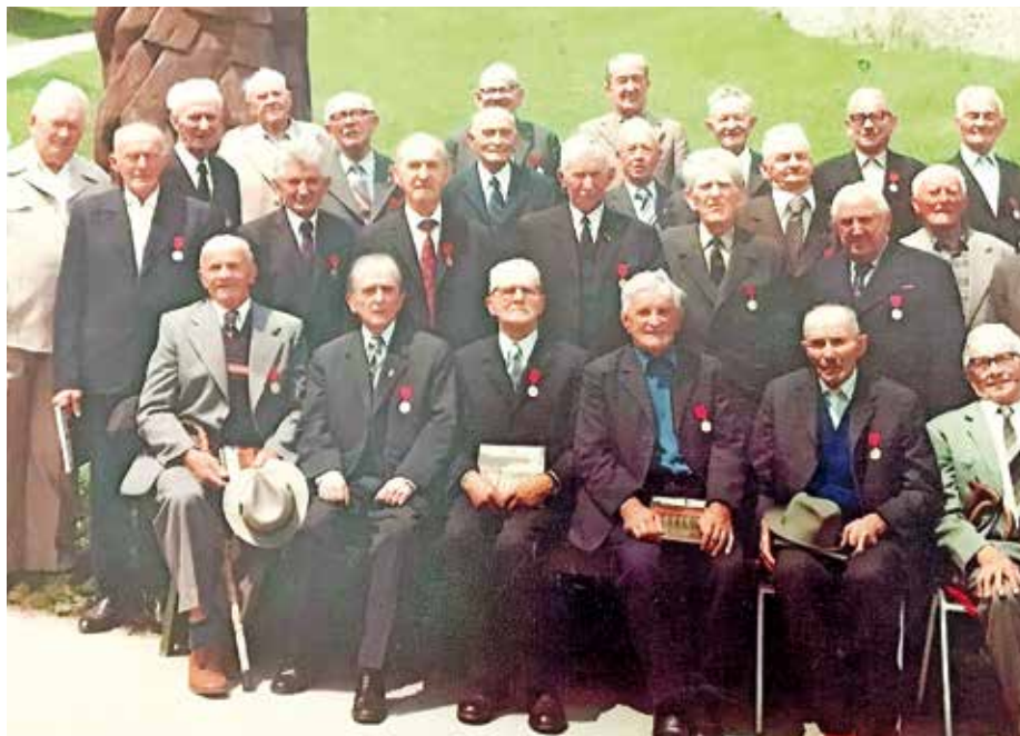
Fotografija 26 leta 1980 še živčih Maistrovih borcev iz takratne občine Škofja Loka (sedanja upravna enota).

O generalu Maistru in njegovih borcih se že pred drugo vojno ni kaj dosti govorilo, krvava morija druge svetovne vojne pa jih je potisnila še globlje v pozabo. Šele leta 1968 so preživel Maistrovi borci dosegli, da je bil na ravni Republike Slovenije sprejet zakon o borcih za slovensko severno mejo. Po tem zakonu pa so status prostovoljca borca za slovensko severno mejo pridobili le tisti, ki so se v enote takratne slovenske vojske vključili do 31. januarja 1919. Vsi drugi so se šteli za mobilizirance in minimalnih bonitet niso bili deležni. V takratni občini Škofja Loka (sedanje območje upravne enote) je 64 oseb pridobilo status prostovoljca, v Žireh pa 16. Pridobiti tak status po petdesetih letih pa ni bilo enostavno. Vsak prosilec je