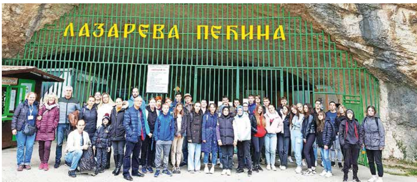
Bor je že vse od konca druge svetovne vojne naprej pomembno rudarsko mesto.

Učenci so hitro opazili, da je okrog njih precejšnja revščina. Številne hiše so nedokončane, mnoge zgradbe propadajo, ker bodisi ni denarja za vzdrževanje bodisi so prazne, ker so se ljudje izselili. Na ulicah vidiš berače, po cestah se vozijo »prastari« avtomobili, vsepovsod se klattijo potepuški psi. Tudi srednja šola, ki je