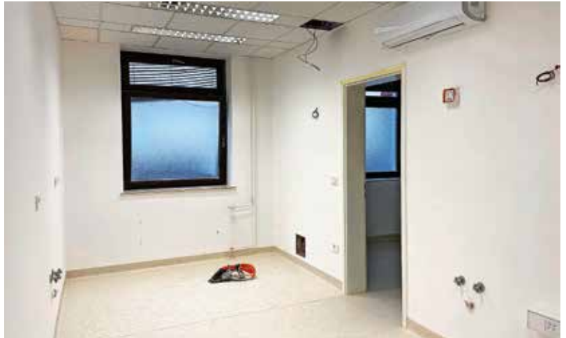
V zdravstvenem domu urejajo novo zobozdravstveno ambulanto.

»Pripravljanje projekta smo začeli spomladi, gradbena in obrtniška dela so se začela avgusta, v najboljšem primeru bo ordinacija nared v drugi polovici novembra,« so razložili v ZD Škofja Loka. V preteklem tednu so tako zaključili mizarska dela, v tem tednu pa sledi še dobava in montaža zobozdravniškega stola. Celotna naložba bo vredna 71 tisoč evrov.