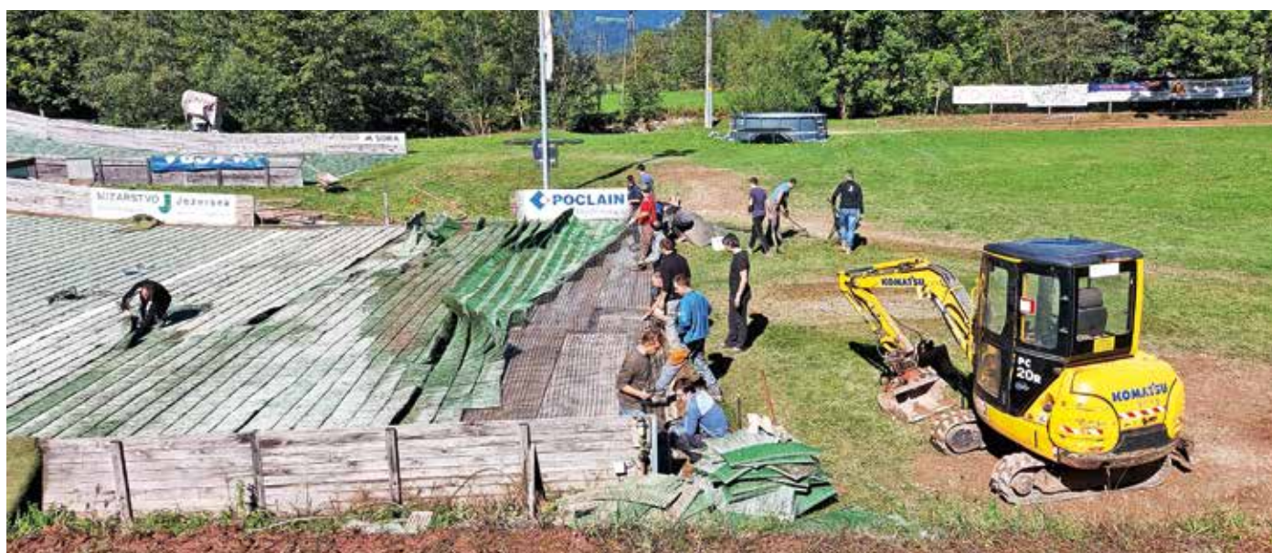
Sanacija škode po poplavih / Foto: Andraž Kopač

Glede na to, da smo v zaključku oktobra, prav tako z veseljem sporočamo, da smo letos beležili visok vpis najmlajših članov. Vsekakor pa bomo veseli, če se nam bo v prihodnje pridružil še kak član.