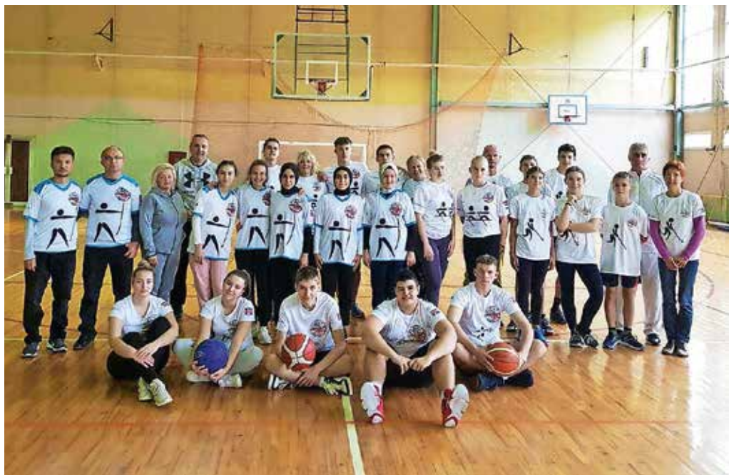
Osrednja športna dejavnost na gostovanju v Srbiji je bila kajpada košarka.

Leta 2018 so rudnike s pripadajočo opremo kupili Kitajci in od takrat naprej se dnevni kopi večajo, količina pridobljenega in prodanega bakra pa iz dneva v dan narašča. Danes je v rudniku zaposlenih več kot sedem tisoč kitajskih delavcev in okrog pet tisoč domačinov, ki so za srbske razmere kar dobro plačani – njihov mesečni prihodek je od dva- do trikrat tolikšen kot plača učitelja. Vendar pa je to zgolj ena plat zgodbe, druga je mnogo bolj temačna in zastrašujoča. Kitajci zaradi širitve rudnikov preseljujejo domače prebivalstvo, zrak v Boru in njegovi okolici je ves čas poln drobnih delcev prahu, ljudje množično zbolevajo zaradi boleznih dihal in umirajo prezgodaj. Ko sem se pogovarjala s tamkajšnjimi ljudmi, sem v njihovih besedah in izrazih