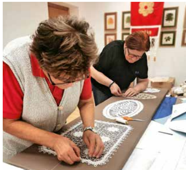
Ta veseli dan kulture bodo v Žireh zaznamovali z odprtjem razstave Klekljane čipke, »špice« na Žirovskem.

Razstava Klekljane čipke, »špice« na Žirovskem je nastala na pobudo Občine Žiri. Strokovno jo je pripravil Loški muzej Škofja Loka v sodelovanju s Klekljarskim društvom Cvetke Žiri, Muzejskim društvom Žiri in Čipkarsko šolo Žiri. Vse ljubitelje klekljanja vabimo na odprto razstavo, ki bo v soboto, 3. decembra 2022, ob 17. uri v Stari šoli v Žireh. Veselimo se vašega obiska. Projekt sofinancirata Evropska unija iz Evropskega kmetijskega sklada za razvoj podeželja in Republika Slovenija v okviru Programa razvoja podeželja 2014–2020.