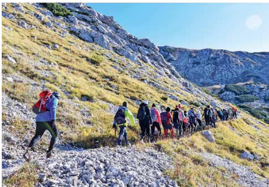
Sedmošolci so se udeležili planinske šole v naravi.

Priznanje za uspešno izpeljan program zaslužijo vsi sodelujoči učitelji in gorski reševalec Rakušček, ki so skupaj zagotovili potrebno varnost v tem projektu. Zahvala gre tudi Planinskemu društvu Žiri ter Občini Žiri za finančno pomoč.