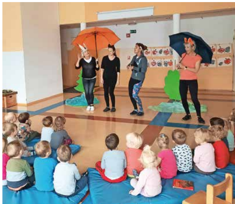
Vzgojiteljice so ob Tednu otroka navdušile v predstavi Pod medvedovim dežnikom.

ci, spoznavali različne inštrumente, prepevali, ustvarjali ob prebrani slikanici in si ogledali predstavo Pod medvedovim dežnikom, ki so jo zanje pripravile vzgojiteljice. Hihitalčki in Raziskovalčki so se družili na skupnem igralnem dnevu in se posladkali s sadnimi nabodali, ki so jih pripravili Raziskovalčki, starejši Skakalčki in Pohajalčki pa so se odpravili na šolski vrtiček, kjer so nabirali žajbelj in sivko ter ob tem veselo prepevali, v okviru filmske vzgoje pa si v domačem kinu ogledali še film Najboljši rojstni dan.