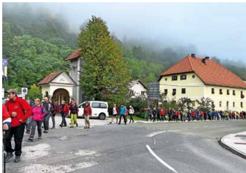
Letošnjega pohoda ob rapalski meji se je udeležilo okrog 140 pohodnikov.