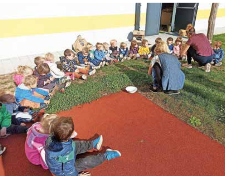
S kostanjem so se na pikniku sladkali tudi najmlajši.

Oktober so začeli s Tednom otroka. Najmlajši jaslični otroci so skupaj z vzgojiteljicami naredili plakat, otroci drugega jasličnega obdobja pa so ta teden uživali na plesni delavni-