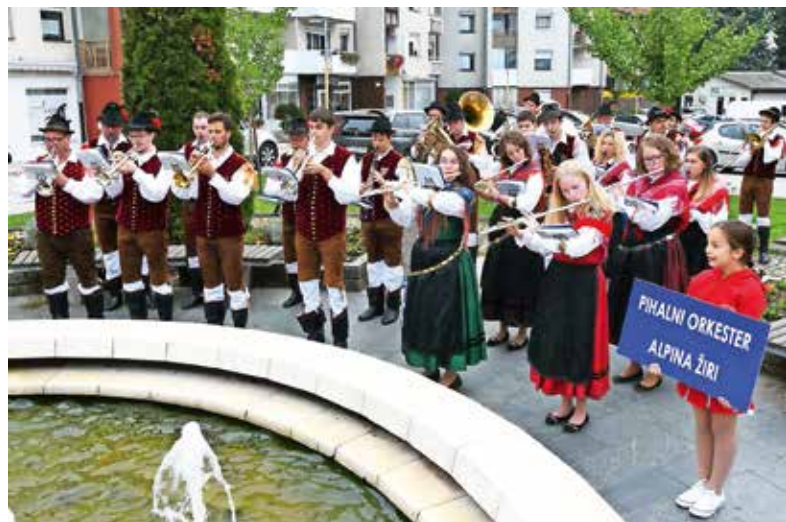
Promenadni nastop Pihalnega orkestra Alpina Žiri na tržnici v Hrastniku

A leto 75. obletnice ustanovitve si bomo zapomnili tudi po tem, da smo se konec aprila poslovili od častnega člana našega orkestra, dolgoletnega predsednika Vikija Žaklja. Tudi pol leta po tem, ko ga ni več med nami, lahko potrdimo, da nas njegova raznovrstna zapuščina pogosto spomni nanj. Zadnje tedne, ko preurejamo zalogo narodnih noš, se čudimo njegovi vestnosti pri skrbi za vsa oblačila, ki so še vedno dobro ohranjena, da jih lahko uporabljamo še danes, pa so nekatera stara več kot 20 let. In kadarkoli pripravljamo koncertni program in prečesavamo arhiv, se z občudovanjem prebijamo skozi obsežno zbirko not, ki jo je Viki skrbno hranil (not je več kot 700!). Da niti ne govorimo o tem, kako nas na gostovanjih godbeniki še vedno sprašujejo po vsepovsod znanem Vikiju. Naša skupna pot se je morda res končala, a vsaj za budnico bo zagotovo vedno zavila tudi mimo Vikijeve Nade.