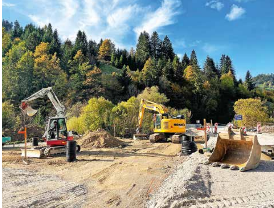
Ob ugodnih vremenskih razmerah bodo v kratkem končali prvo fazo gradnje obvoznice od cerkve do logaškega mostu.

Prvo fazo gradnje obvoznice od cerkve do logaškega mostu bodo v kratkem končali, če bodo vremenske razmere to dopuščale.