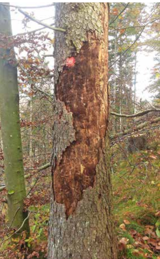
Za lubadarke je značilno tudi odstopanje in odpadanje skorje z debla. / Foto: arhiv ZGS

nikov lahko pričakujemo tudi v prihodnjem letu. Jeseni in pozimi bo Zavod za gozdove Slovenije nadaljeval pregled gozdov in lastnikom gozdov z odločbo določal posek s podlubniki napadenih dreves – lubadark. Lubadarke v poznem poletju in jeseni prepoznamo po rjavi črvini okoli koreničnika in za luskami skorje, odpadanju iglic z obarvane ali še zelene krošnje ter odstopanju in odpadanju skorje z debla. Čez zimo smo po-