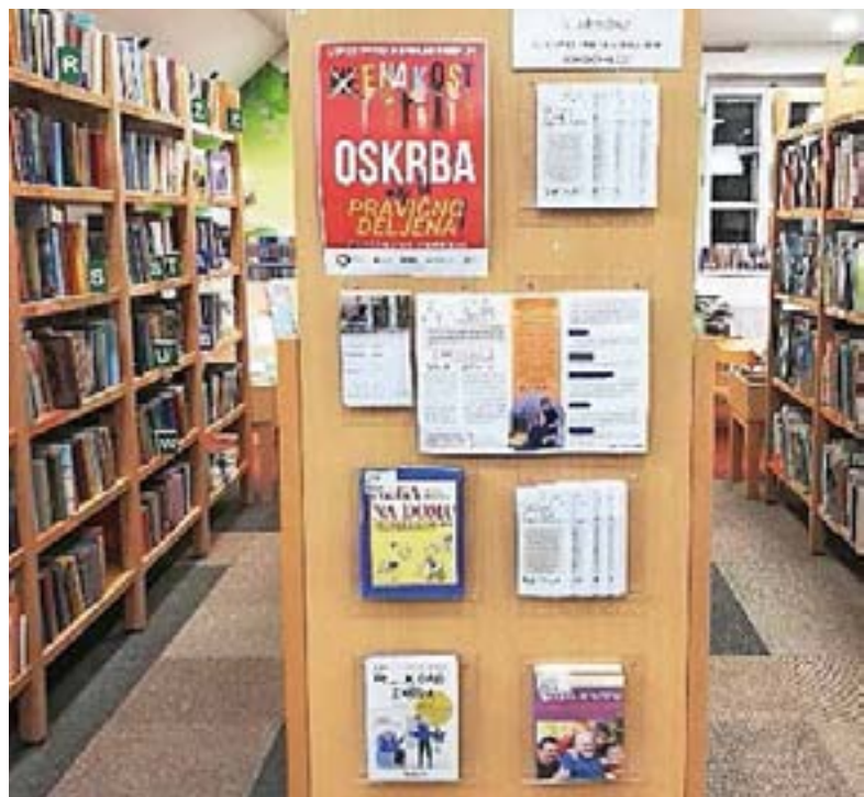
Stojnica v Krajevni knjižnici Žiri

Inštitut Antona Trstenjaka, Starosti prijazne občine in Slovensko združenje neformalnih oskrbovalcev so ob dnevu neformalnih oskrbovalcev organizirali številne akcije po vsej Sloveniji. Poseben poudarek je bil na širjenju glasu o Združenju nefor-