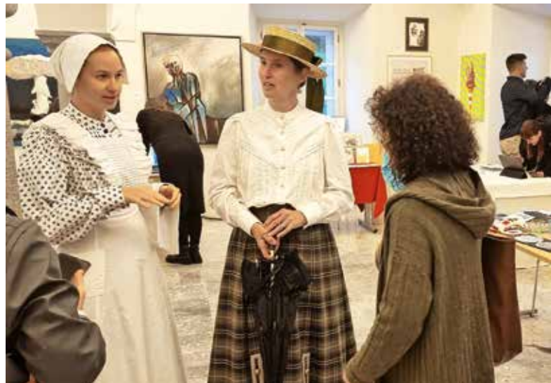
V Kulturnem središču Stare Žiri so predstavili projekte, ki so jih sofinancirali s pomočjo sredstev v okviru projekta CCI4Tourism.

Škofjeloška trgovina Rozamunda je v sodelovanju s Turističnim društvom Škofja Loka v sklopu projekta razvila spominke Loške hiše. Motive loških hiš je mogoče najti na razglednicah, priponkah, čokoladah, vrečkah in majicah. KUD Kamot je v sodelovanju s Turističnim društvom Gorje v sklopu projekta nadgradil njihovo tematsko pot Začaran gozd s slikanico Volčje potovanje od Vintgarja do Soteske. Gostilna Pr' Pepet in E-Art Institut sta predstavila glasbeno-gastronomski abonma Loške glasbene vilice. V okviru omenjenega abonmaja so si zamislili večerjo s štirimi hodi, ki jo pospremi s koncertom v kletnih prostorih gostilne v predahu med posame-