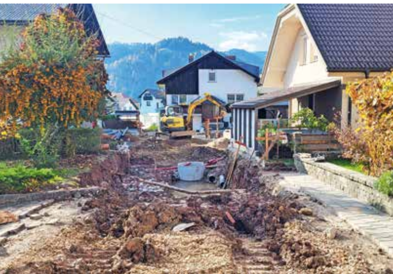
Pred kratkim se je začela obnova Ulice Maksima Sedeja.

količino padavin na srečo ni bilo veliko škode na javni infrastrukturi,« je zadovoljen Kranjc.